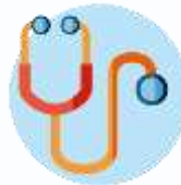
Health & PA