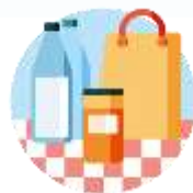
Consumer Goods/ Largo Consumo