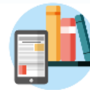
Media & Publishing